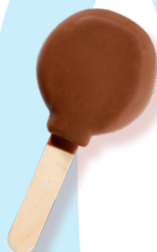
STIKO VANIGLIA CIOCCOLATO

Vanilla flavor with white chocolate and roasted almonds coating. Cod. 500.0041