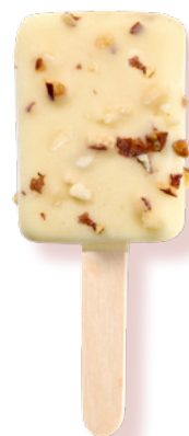
STIKO CIOCCOLATO BIANCO

Cookie flavour with crunchy cookie pieces. Cod. 500.0026